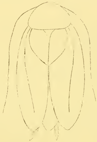
Fig. 3. Ect. lividus FABR. ♀ Valais.

Quant à la synonymie de notre forme et à sa description